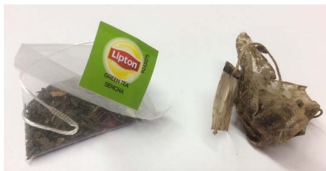
Les sachets de thé, original et déterrés.