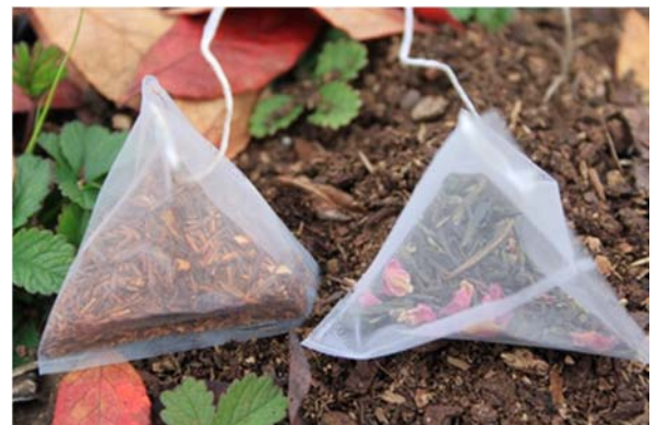
Les sachets de thé (rooibos et thé vert) avec le filet de nylon.

Avec l'utilisation de deux types de thé contrastés, les taux et les facteurs de stabilisation de la décomposition peuvent être comparés entre les parcelles et les sols. Cette approche fait partie d'une étude mondiale sur les effets géo-climatiques sur la décomposition.