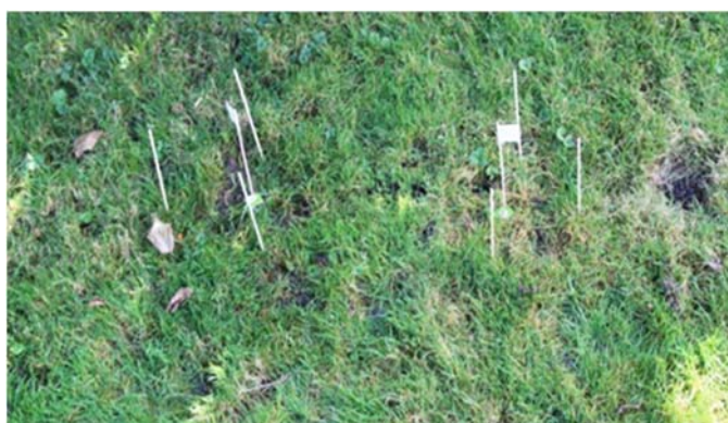
Des baguettes montrant où les sachets de thé sont enterrés dans un jardin.