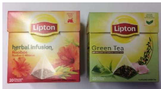
Sachets de thé Lipton.

* Vous obtiendrez un rabais de 10%, lorsque vous entrez "tbi" dans le champ approprié sur le site de facturation.